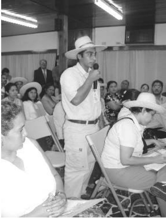
Momentos en que los jóvenes realizaron preguntas a los integrantes de la Junta Directiva y Comisión de Calificación y Credenciales, de PROFAMILIA.