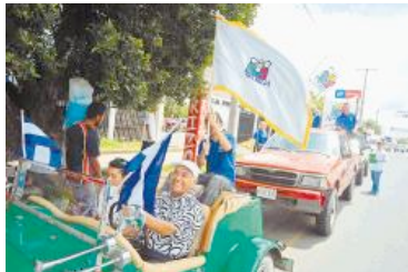
Un grupo de Profamilia se manifestó a favor de que sus derechos sean reconocidos por la sociedad nicaragüense.

Carlos Martínez Morán nacionales@laprensa.com.ni